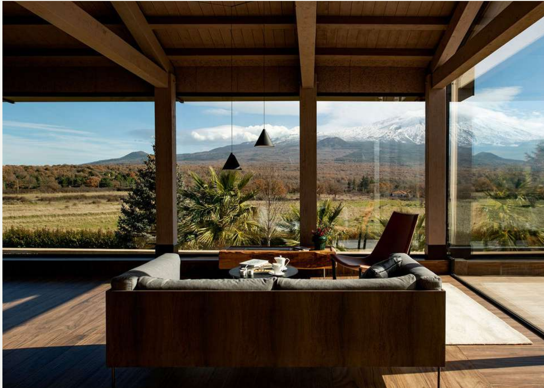
Etna view from the restaurant CULT di Fucina